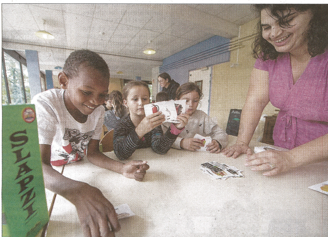
JEUX. Les différents jeux proposés tout au long du séjour permettent aux enfants de développer plusieurs compétences.

los apprenantes » est censé être complémentaire de l'école. Mis en place par l'Etat à l'issue des différents confinements, ce dispositif a été créé afin de répondre à des besoins d'expériences collectives. Ce label permet à des séjours de renforcer des apprentissages et activités de loisirs autour de la culture, du sport et du développement durable. « Cela donne aussi la possibilité aux enfants de renforcer