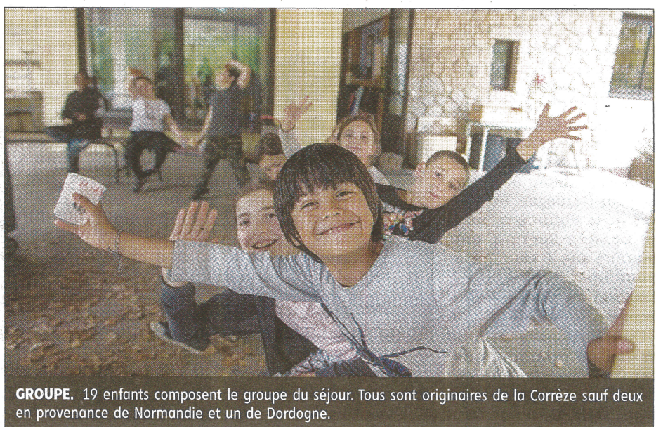
GROUPE. 19 enfants composent le groupe du séjour. Tous sont originaires de la Corrèze sauf deux en provenance de Normandie et un de Dordogne.