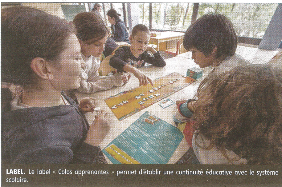
LABEL. Le label « Colos apprenantes » permet d'établir une continuité éducative avec le système scolaire.

En avril 2023, un séjour d'itinérance en vélo à travers la Corrèze organisé par Voilco-Aster pourrait voir le jour sous le même dispositif. ■